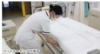
ベッドメイキングの様子

6月、1年生がベッドメイキングの技術練習を行いました。事前学習として、各自準備をして臨みましたが、シーツの皺がないようにベッドを作ることは簡単ではありませんでした。ポディメカニクスを活用して、自分の身体に負担をかけず、患者さまの快適な環境を考えたベッドメイキングを行うことが出来るよう、日々、練習に励んでいます。