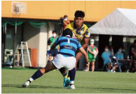
圧倒的なパワーを持つアシナテ・サヴ選手