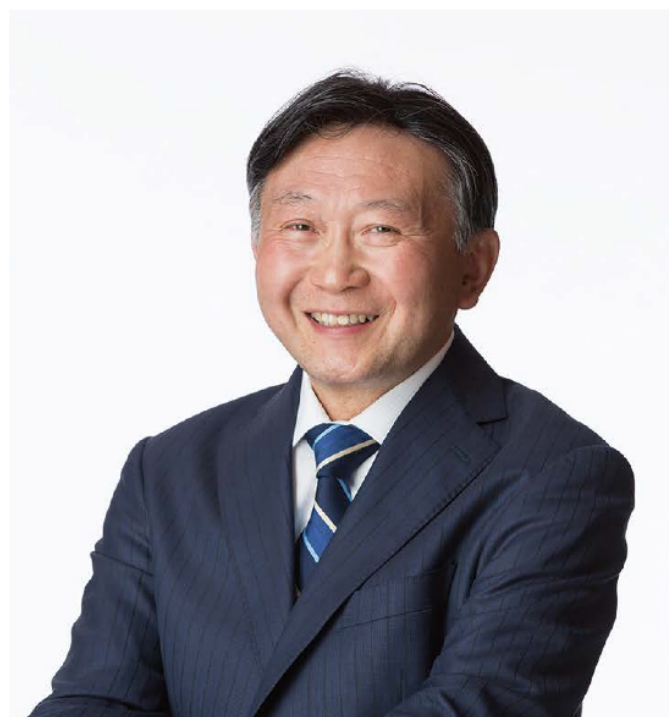
医療法人横浜未来ヘルスケアシステム 理事長 戸塚中央メディカルケアグループ(TMG) 理事長

さらに歯科口腔外科の新設、整形外科・リハビリテーション分野で運動機能再起センターをオープンするなど、診療体制が大幅に充実しました。