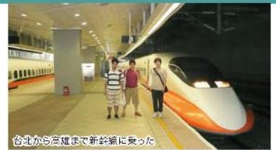
台北から高雄まで新幹線に乗った

バイオ関連の仕事をしてちょっと毛色が変わった発表を台湾に持っていった。台北は過去に幼い娘たちを伴って友人の結婚披露宴に出たことがある。小籠包という馴染みのあるメニューだが、それがほんとに美味しいと言われる店に行った。美味しかった。それから予約が必要で言葉がわからない店には宿の主人に頼んで聞いてもらって行ったが、記憶に残る最高の北京ダックだった。台湾の人は皆優しい。バスの運転手ですら、この面倒な客に親切に真摯に対応してくれる。頭が下がる思いだった。故宮博物院の翠玉白菜はすごかったが、昔の人はどうやってこれを作ったのだろう。高雄まで新幹線の往復切符を買って、南シナ海を見に行った。砂浜は湘南海岸のような黒っぽい砂。帰国の前夜は新北投温泉に泊る。温泉は硫酸塩泉という白っぽい湯だったが、露天風呂には人が多過ぎた。台北駅そばの三越だったか、宿泊先から目と鼻の先、デパートの地下飲食店街はここも最高だった。この国は何を食べても美味しかった。(次回はナイアガラの滝、カナダ)