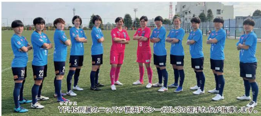
YFHS所属のニッパツ横浜FCシーガルズの選手たちが指導します。

サステナビリティ活動として、横浜未来ヘルスケアシステムに勤務する選手たちがサッカーの普及と教育、子どもたちの心身の発達と健康づくり、地域交流を目指して、戸塚区で幼児向けのサッカー教室を開催中です。