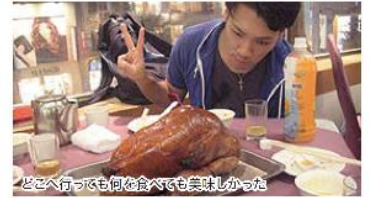
どこへ行っても何を食べても美味しかった