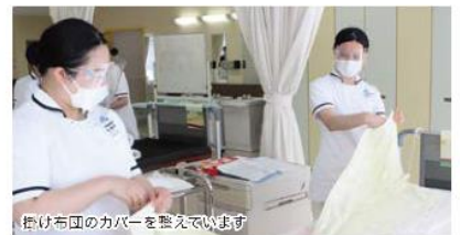
掛け布巾のカバーを整えています