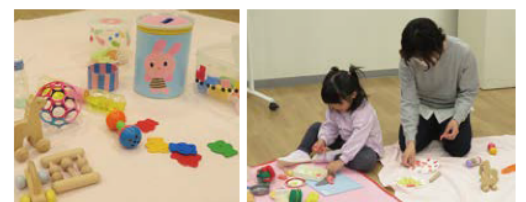
スタッフお手製によるおもちゃも好評です!